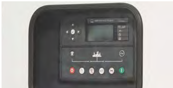
Панель управления с дистанционным запуском и запуском при отсутствии питания

Модели серии QIS / QI по умолчанию оборудуются панелями управления, позволяющими эксплуатировать генератор в качестве резервного источника питания. Данные панели осуществляют мониторинг напряжения в сети, включают/выключают генератор при пропадании/появлении напряжения в сети, управляют переключением блока контакторов. Опционально предлагаются панели для организации параллельной работы.