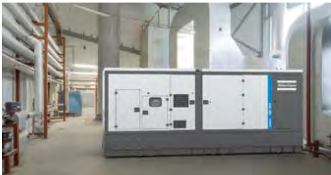
Промышленные и социальные объекты