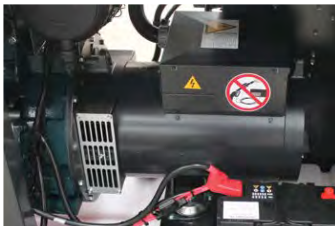
Альтернатор с перегрузочной способностью по току 300 % в течение 20 секунд