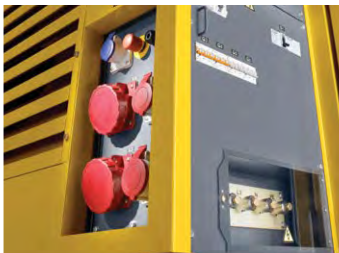
Силовые розетки (опционально)