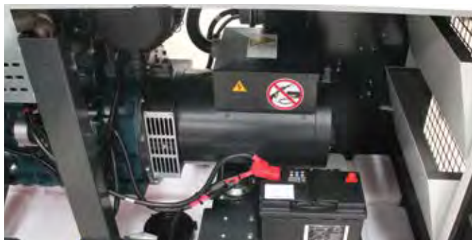
Альтернатор с перегрузочной способностью по току 300 % в течение 20 секунд

Модели серии QIS / QI по умолчанию оборудуются панелями управления, позволяющими эксплуатировать генератор в качестве резервного источника питания. Данные панели осуществляют мониторинг напряжения в сети, включают/выключают генератор при пропадании/появлении напряжения в сети, управляют переключением блока контакторов. Опционально предлагаются панели для организации параллельной работы.