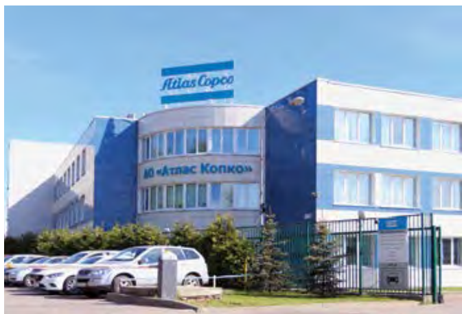
Компания «Атлас Копко» 25 лет в России

Наша сервисная служба оказывает полный спектр квалифицированных услуг и несет ответственность за качество выполняемых работ и используемых материалов.