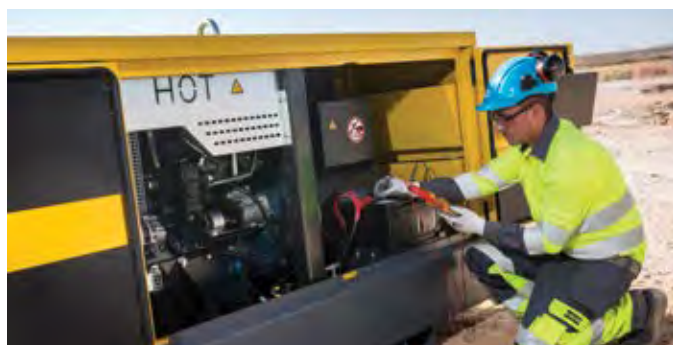
Удобство сервисного обслуживания

Приборная панель оборудована аналоговыми амперметром, вольтметром, панелью управления с ЖК-дисплеем, счетчиком часов работы, указателем уровня топлива, 4-х полюсным защитным автоматическим выключателем, распределительной клеммной колодкой для подключения силовых кабелей и кнопкой аварийной остановки.