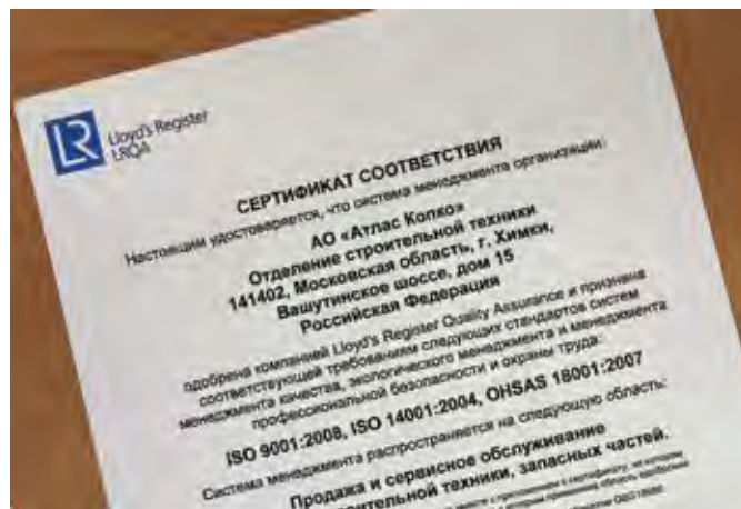
Сертификат соответствия стандартам ISO 9001, ISO 14001 и OHSAS 18001