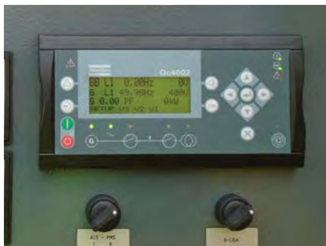
Панель управления с возможностью синхронизации работы (опционально)