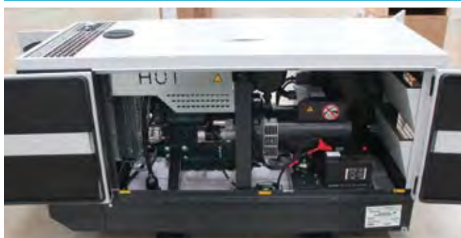
Кожух с широкими распашными дверями для удобства обслуживания

Возможна поставка генераторов в открытом исполнении для локальной установки в контейнер или размещения внутри помещения.