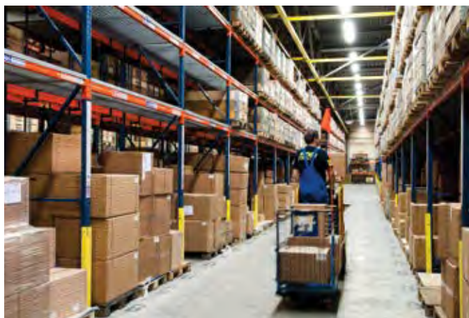
Бесплатная доставка запчастей и расходных материалов по России *