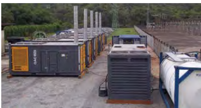
Объекты высокой мощности