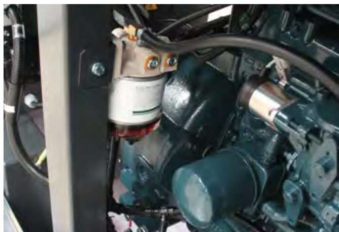
Топливный фильтр высокой степени фильтрации и возможностью слива