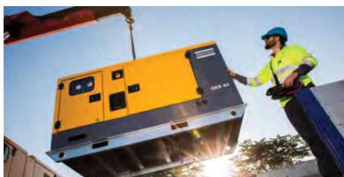
Удобство разгрузки/погрузки и транспортировки

Удобный доступ для обслуживания через большие дверцы, точки слива рабочих жидкостей расположены на раме сбоку генератора.