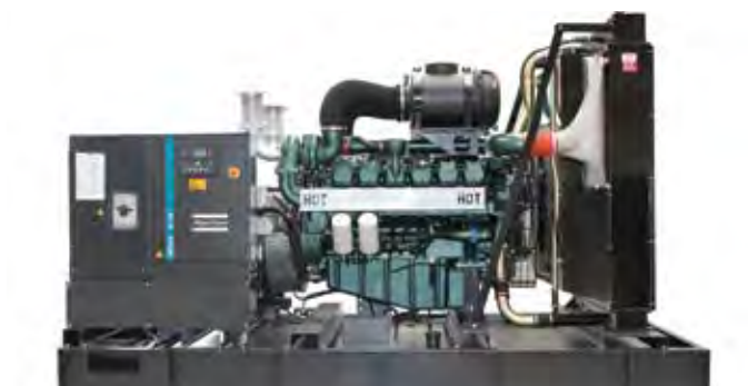
Открытое исполнение (без кожуха)

Надежные компоненты, широкий набор опций и продуманная конструкция генераторов QIS / QI позволяют использовать их в различных применениях как в качестве основного источника энергоснабжения, так и в качестве резервного.