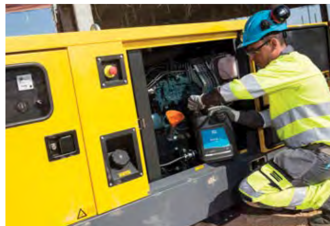
Квалифицированная сервисная служба